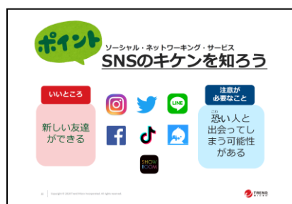
図2：小学校向けの教材例2