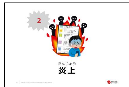
図3：小学校向けの教材例3