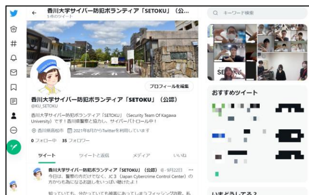
図3：SETOKUの公式アカウント