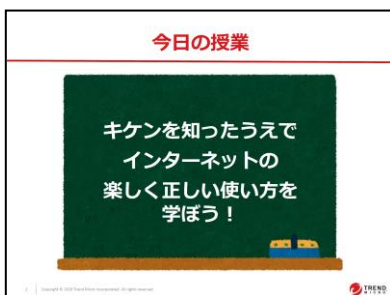
図1：小学校向けの教材例1