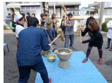
学生企画の地域住民とのふれあい活動