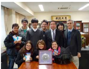
教育学部長表敬訪問