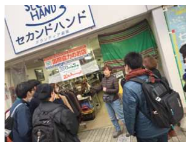
ボランティア体験活動