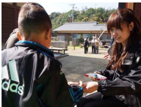
お接待をする留学生

インターナショナルオフィスでは、留学生や日本人学生が、瀬戸内の文化や歴史、芸術等への理解を深めたり、島の伝統行事やイベントなどの交流活動で得た学びを国内外に発信する能力を養うことで、学生の活躍で地域を活性化させる国際交流を目指しています。