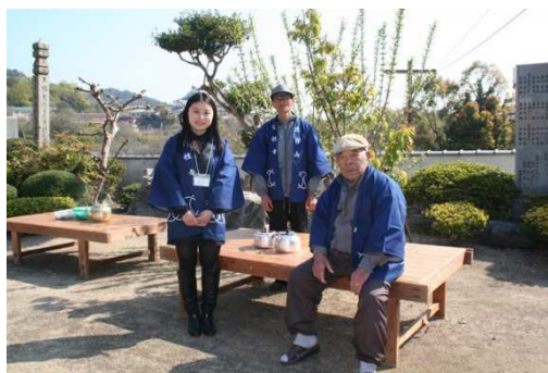
留学生と本島の方々