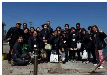
プロジェクトメンバー全員で記念撮影