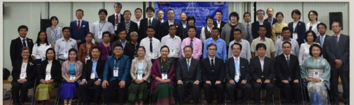
2017年10月 カンボジア教育青年スポーツ省長官歓迎 香川大学学長主催来日研修開講式