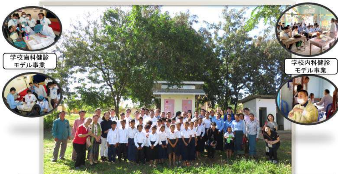
2019年11月 香川大学モデルトイレを背景に、学校歯科健康診断渡航班医師らと参加したカンダルスタン郡児童・教員、健康科学大学歯学部教員