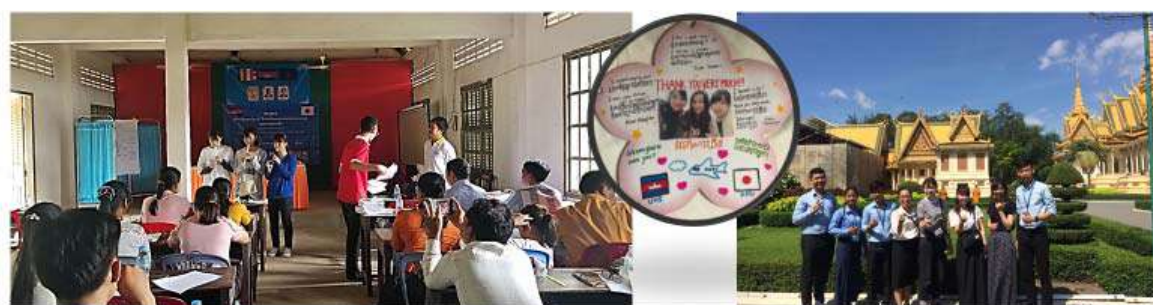
2018年8月 香川大学看護学生夢プロジェクトスタディーツアー(衛生材料の寄付集めと寄贈/UHS学生交流)