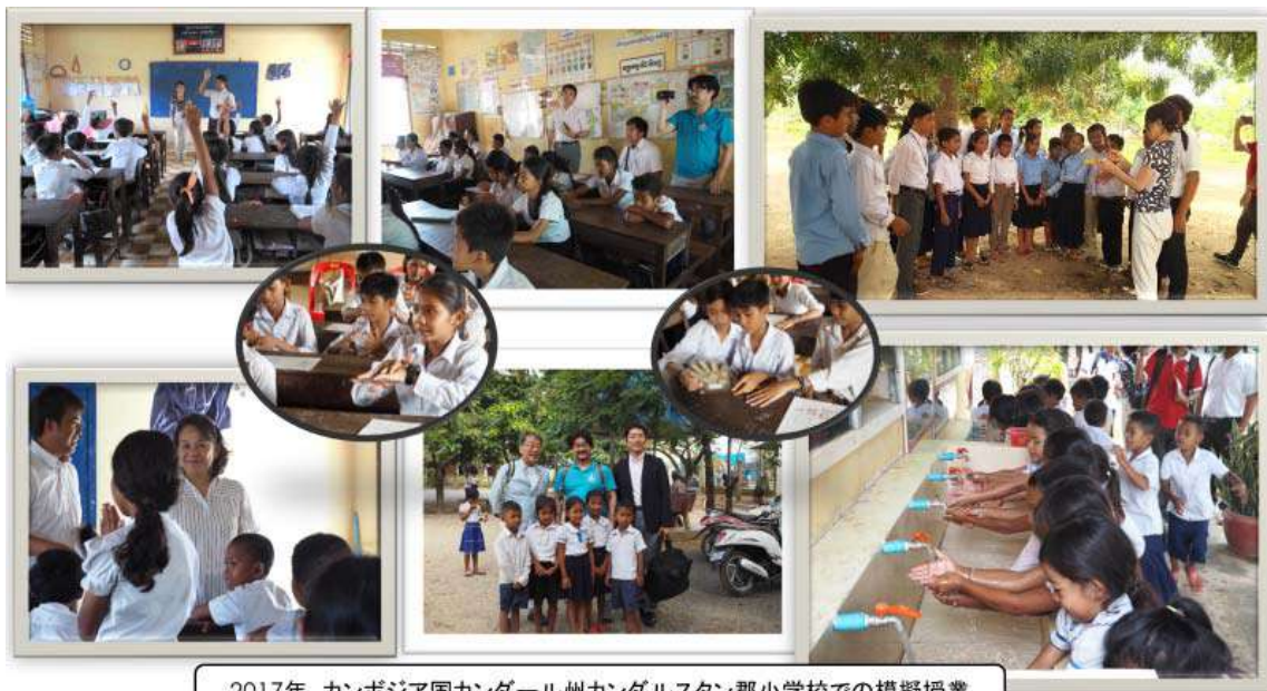
2017年 カンボジア国カンダール州カンダルスタン郡小学校での模擬授業