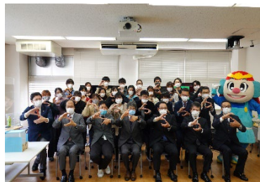
* SETOKU 結成時の写真