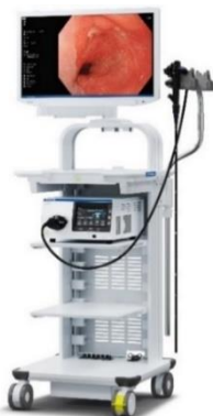
消化器内視鏡システム「EVIS X1」 (システムセット例)

「EVIS X1」は、オリンパス独自の技術の搭載に加え、従来機である「EVIS LUCERA ELITE」と「EVIS EXERA III」の、それぞれ異なるスコープラインアップとの互換性も確保しています。これにより幅広いラインアップのスコープをお使いいただけ、内視鏡による診断・治療の可能性拡大に貢献します。