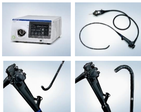
(左上) EVIS X1 ビデオシステムセンター OLYMPUS CV-1500 (右上) 上部消化管汎用ビデオスコープ OLYMPUS GIF-EZ1500 (左下) 上部消化管汎用ビデオスコープ OLYMPUS GIF-XZ1200 (右下) 大腸汎用ビデオスコープ OLYMPUS CF-XZ1200 シリーズ